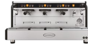
BL-100 3 Gr Tall cup