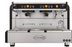
BL-100 2 Gr Tall cup