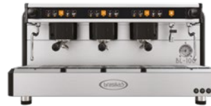
BL-100 3 Gr