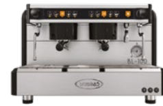
BL-100 2 Gr