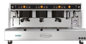
BL-300 3 Gr