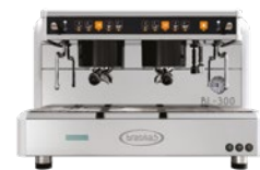
BL-300 2 Gr