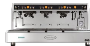
BL-300 3 Gr Tall cup