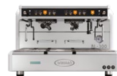
BL-300 2 Gr Tall cup