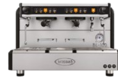
BL-100 2 Gr Tall cup